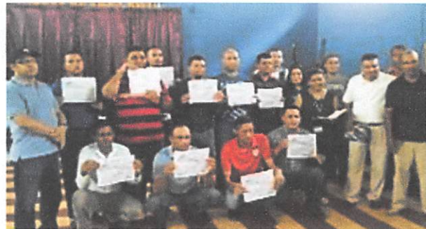
C.P. JUTICALPA (Discipulado Evangélico)