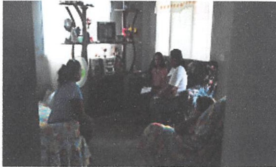
Visita Domiciliaria La Paz