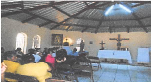
C.P. PNFAS (Misa Católica)

Toda persona tiene derecho a la libertad de pensamiento, de conciencia y de religión; para tal efecto El Instituto Nacional Penitenciario (INP) tiene las funciones de promover asociaciones de Privados de Libertad para desarrollar actividades que coadyuven a sus procesos de Rehabilitación, Reeducación y Reinserción, por lo cual el INP proporciona espacios físicos en el interior de la mayoría de Establecimientos Penitenciarios para la práctica y fomento de actividades religiosas.