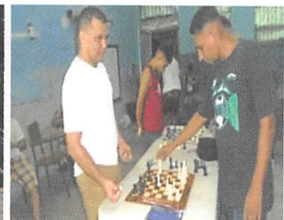
Torneo Ajedrez C.P. Tela