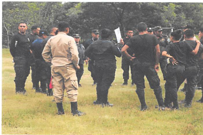
Capacitación en previsión de Siniestros y Contingencia impartida por miembros del cuerpo de Bomberos al Personal CP de Nacaome Valle

Se están realizando a nivel nacional en los diferentes establecimientos penitenciarios Seminario-talleres con una duración de 48 horas impartidos por el Cuerpo de Bomberos, En temática relacionada con la prevención contra incendios, primeros auxilios e instructivos de evacuación en casos de emergencia, para combatir incendios a todo el personal penitenciario.