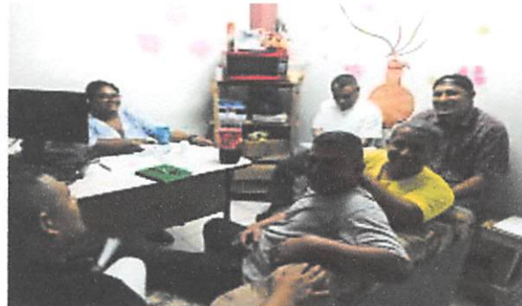
C.P. Comayagua Visita familiares PPL