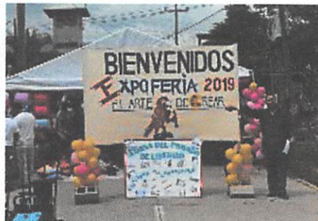
Expo feria C.P. Tamara F.M.