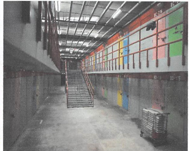
C.P. MAXIMA SEGURIDAD DE TAMARA