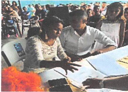
Boda civil C.P. Choluteca,