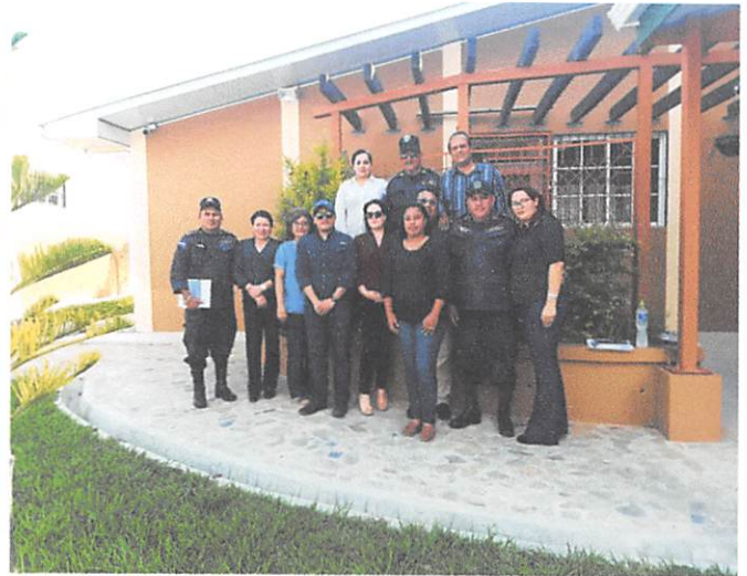
Anexos Fotográficos Curso FFDDHH